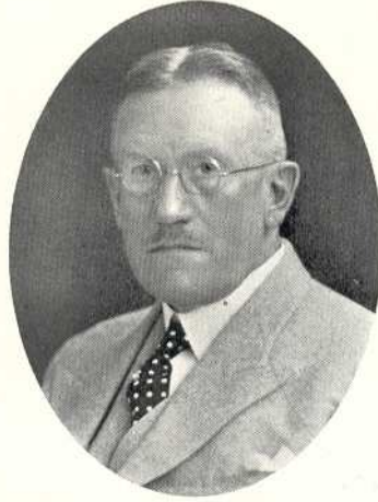
Dir. Edvard Rosenberg.